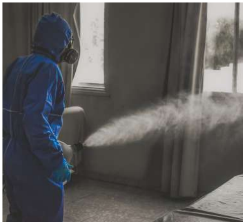
Per applicazione a spruzzo

Packaged in high concentration, always dilute the product to 1/10 with water before application by spray or by arch misting systems.