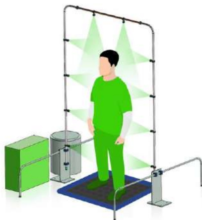
Per sistemi di applicazione ad arco

Upon request, SA 425 LIMPIA AMOVEO PERSONAL is also available in no rinse gel formula, for quick disinfection of hands and objects;